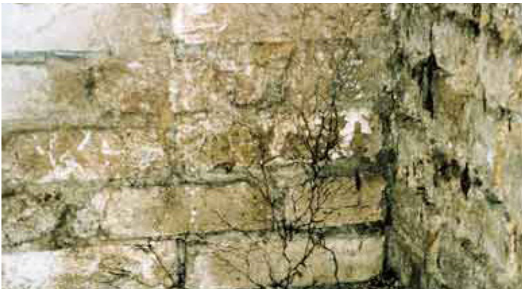
Ältere Stränge des braunen Kellerschwamms auf dem Mauerwerk.